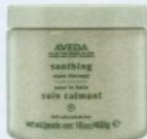
Aveda erfrischt mit Salzen aus dem Toten Meer