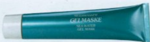
Die unparfümierte Meerwasser Gelmaske von Franziska Teebken strafft die Gesichtskonturen

Bitte schicken Sie mir kostenlos und unverbindlich genaue Informationen!