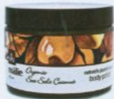
Das Körperpeeling von Malie Kauai revitalisiert die Haut