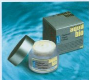
Das System Thalasso von Aquabio (Logocos) wirkt Fältchen entgegen