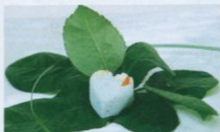
Die Beti Lue-Badepraline enthält Spirulinapulver und sorgt für sanfte Rückfettung der Haut