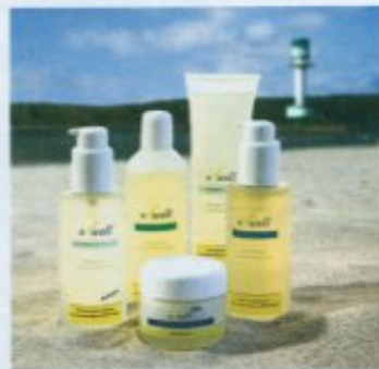
o'well spendet mit der Laminaria-Alge der Haut Feuchtigkeit

Das mineralstoffreiche Salzkristall-Körperpeeling von Julisis reinigt sanft und schonend