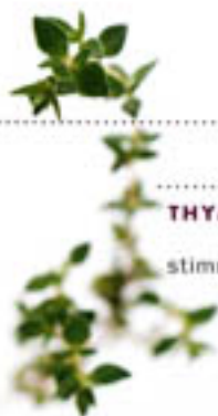
THYMIAN: Ätherisches Öl wirkt anregend, stimulierend und fördert die Zellneubildung