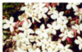
JASMIN: anregend und zugleich entspannend