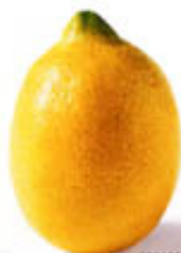
ZITRONE: antiviral, anregend und Stimmung aufhellend