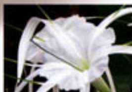
SCHÖNHÄUTCHEN: Sein feines Aroma ist die Herznote von Spider Lily