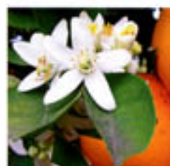
ORANGENBLÜTE: Ihr Aroma ist entspannend, wirkt antidepressiv und harmonisierend