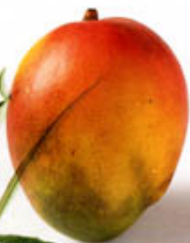
MANGO: reich an Vitamin E, hält freie Radikale in Schach. Sträffend und aufbauend